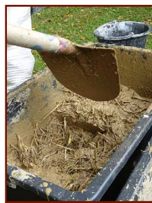
Lehm Stroh Wasser